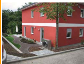
Besonders leise Luftwärmepumpe